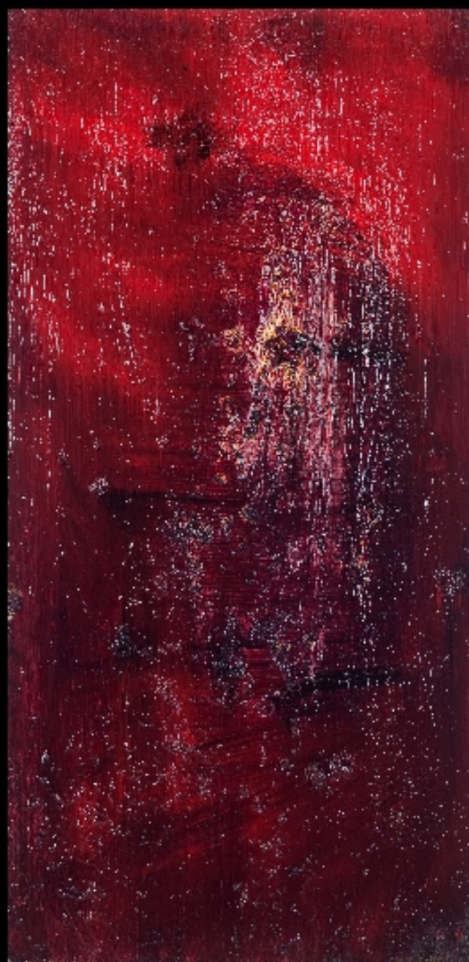
Maschere olio su tela 30X60