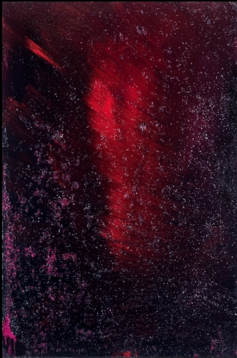
Libertà alio su M34 #0090