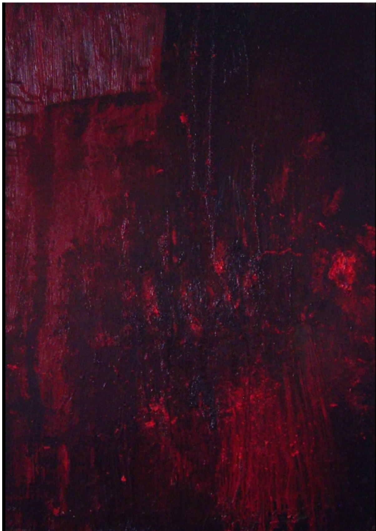
“ Amore “ Olio su tela/Oil on canvas 2005 cm 70 x cm 100 € 2.000