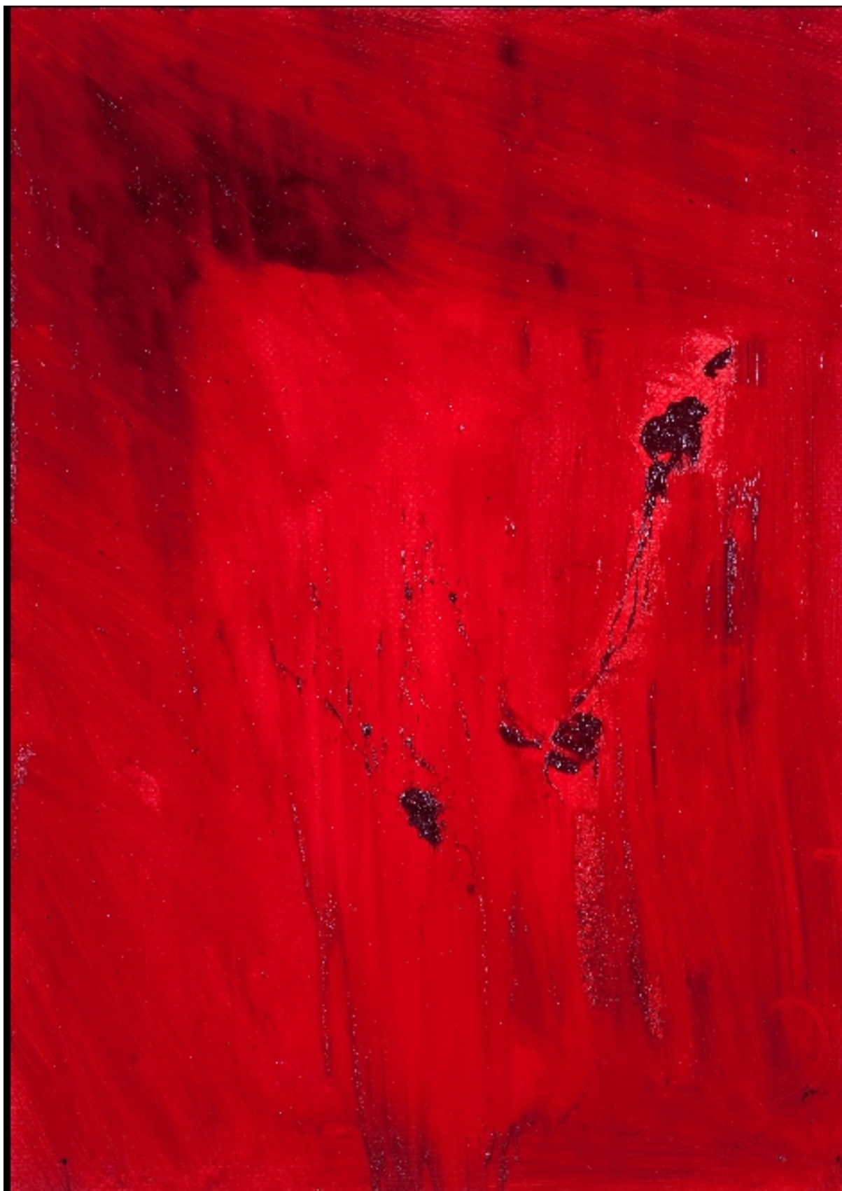
“ Visione “ Olio su tela/Oil on canvas 2011 cm 70 x cm 100 € 2.500