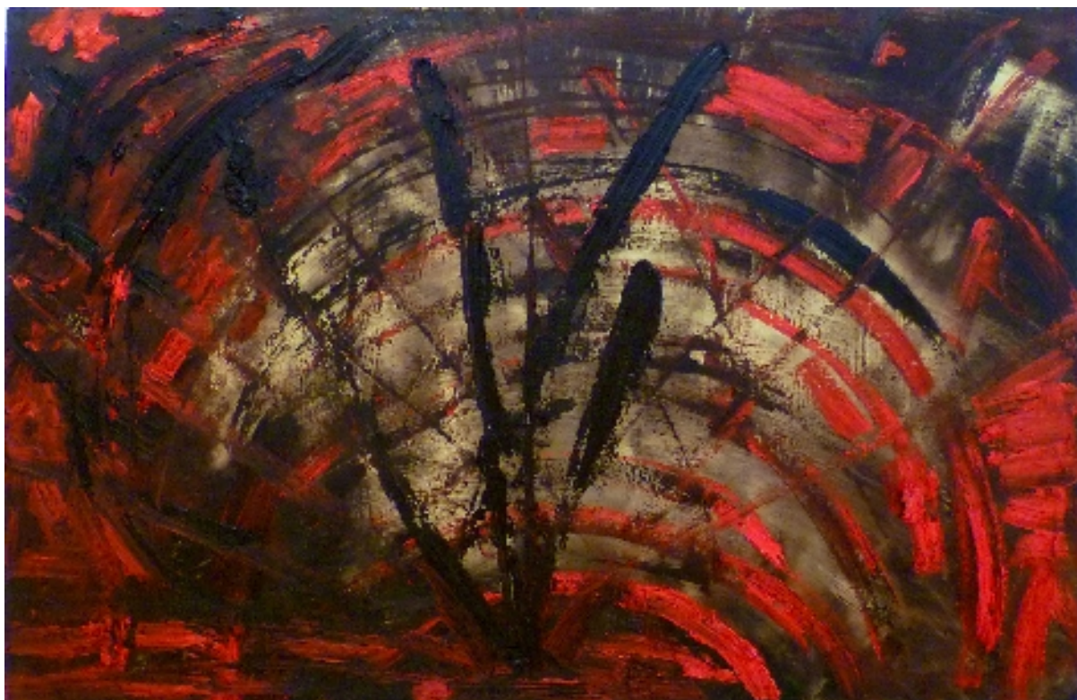
“ Mal di terra “ Olio su tela/Oil on canvas 2011 cm 150 x cm 50 € 3.000