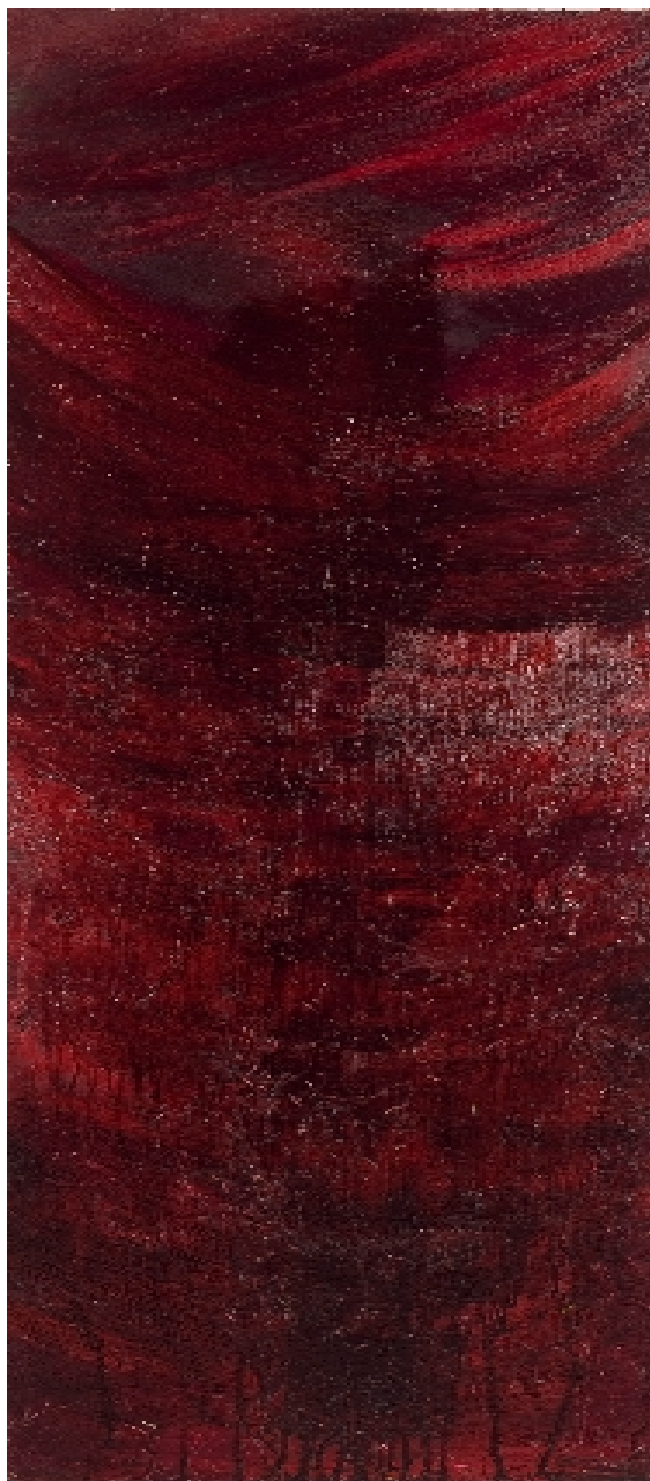
“ Giudizio “ Olio su tela/Oil on canvas 2011 cm 50 x cm 150 € 2.500